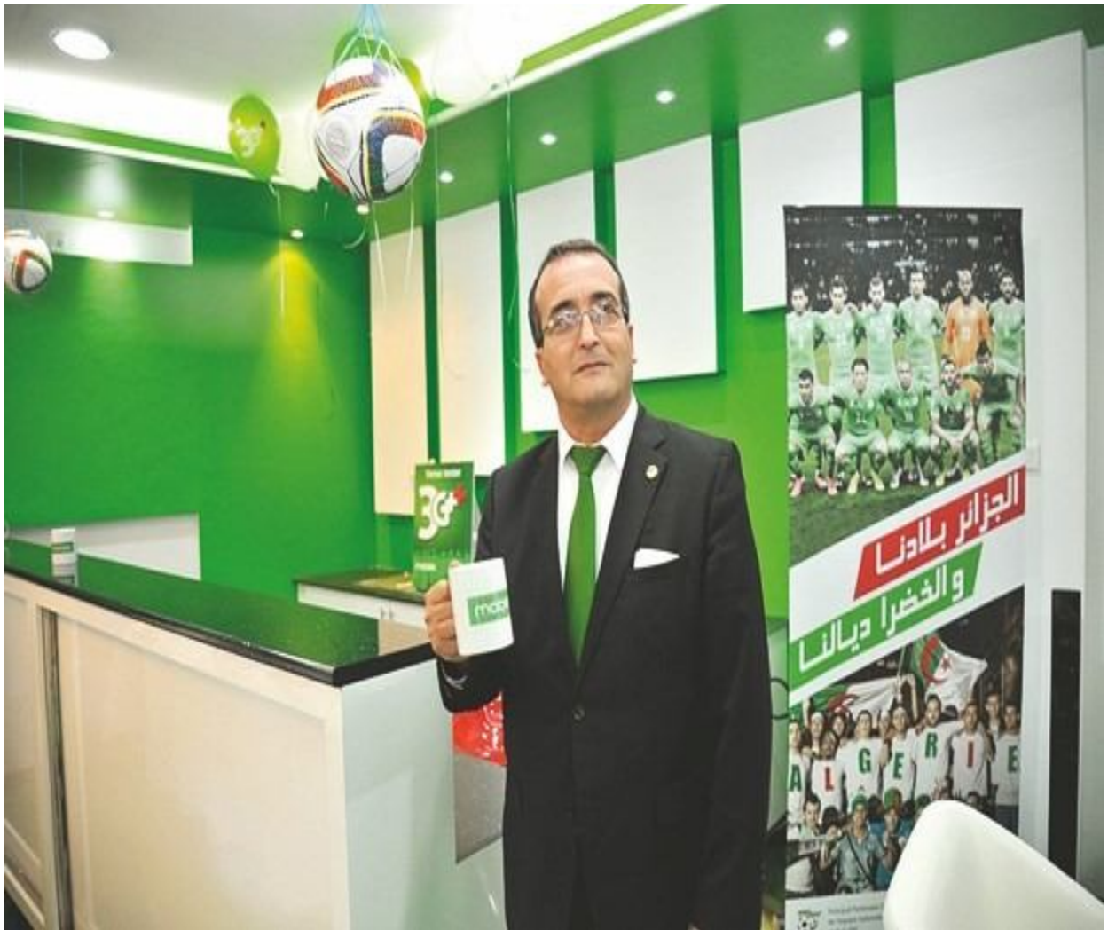
MOBILIS, sponsor officiel de l'équipe national de foot Ball