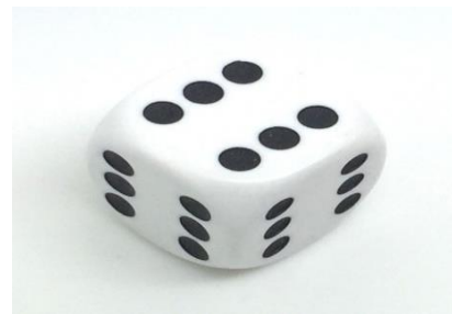
figure 03 : un dé pour les pronoms