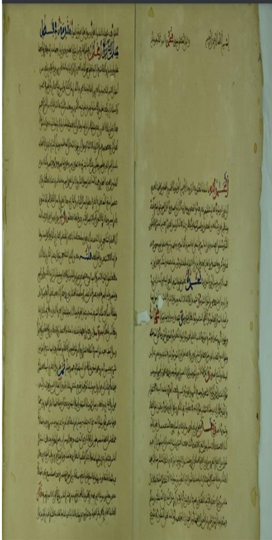
السللاوي الناصري، مخطوط الاستقصا لأخبار دول المغرب الأقصى، (المخطوطة ملك خاص).

الصفحة الثانية من مخطوط الحلل الهبية للمشرقي،