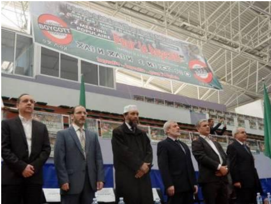
zoom | © Photo Salim M. El Watan Les présidents des partis membres de la CLTD Imprimer Envoyer à un ami Flux RSS Partager

L'instance de suivi et de concertation de la Coordination pour les libertés et la transition démocratique (CLTD) s'est réunie, hier jeudi à Alger. Les membres de cet aréopage, regroupant des partis et des personnalités de l'opposition politique, ont estimé que la lutte contre la corruption ne peut pas aboutir en « l'absence d'une justice indépendante en Algérie ».