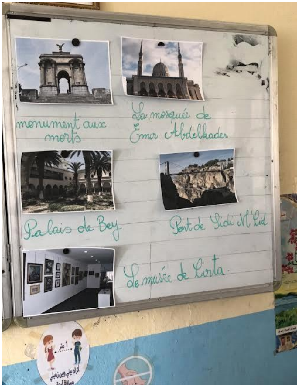
Annexe 4 illustration production N°03