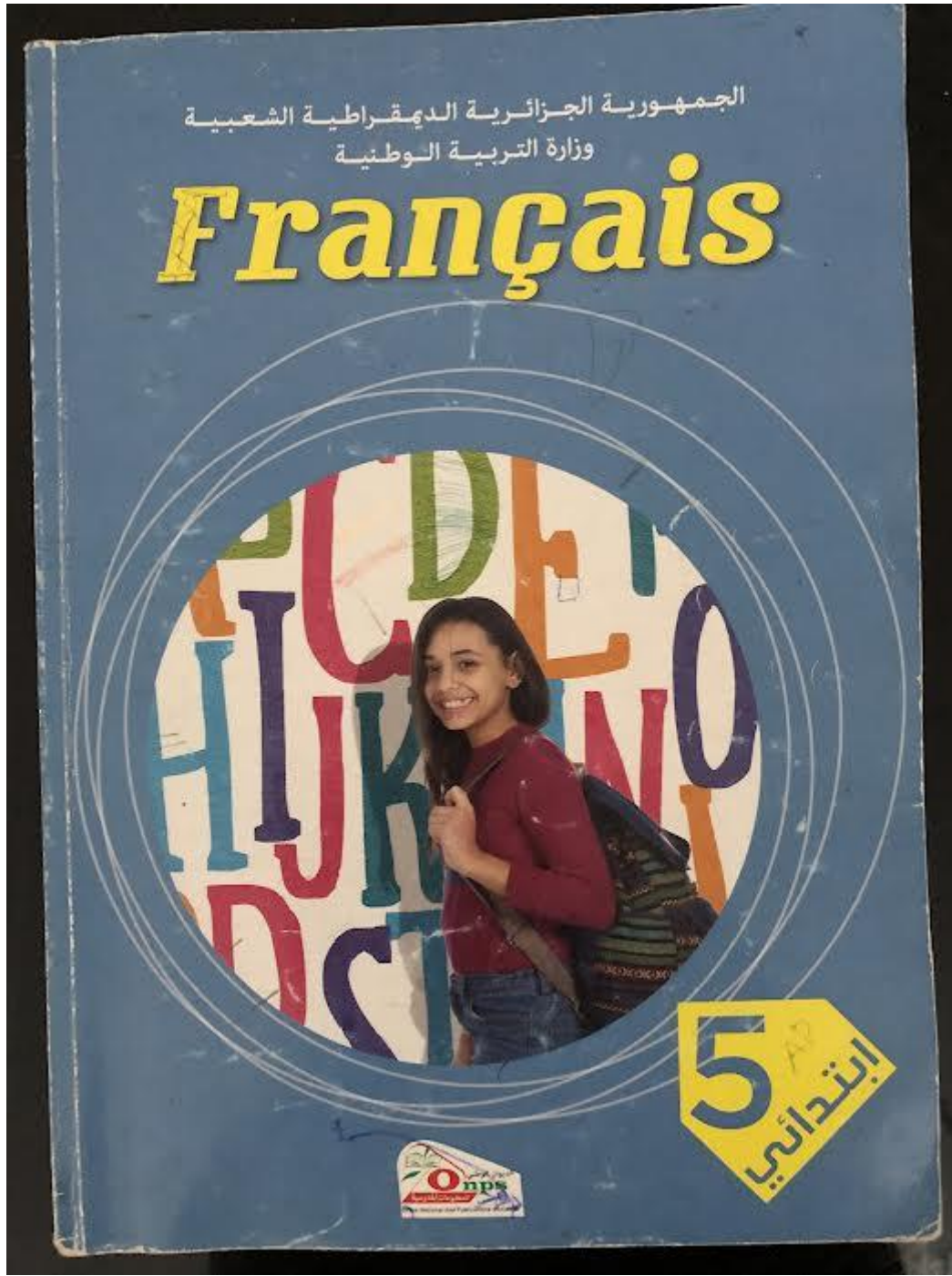
Annexe 1 Manuel scolaire 5eme AP