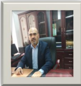
رئيس تحرير المجلة: أ.د عرشوش سفيان