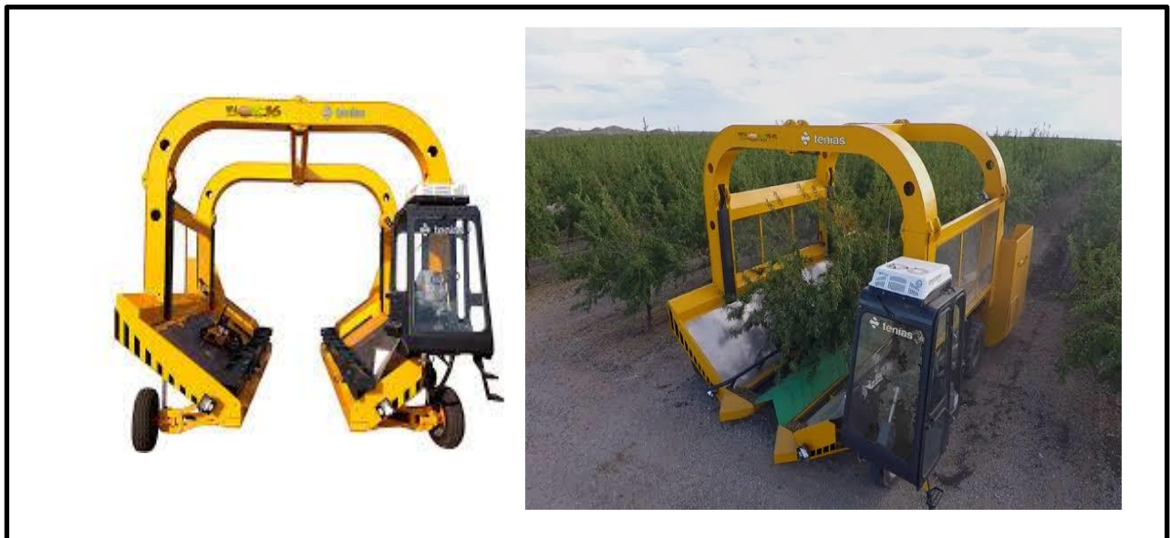
Figure 7: machine de chevauchante ; Tenias Harester

La distance de plantation choisie par les techniciens a été de 5,5 m, en tenant compte de la hauteur de l'amandier qui ne dépasse pas les 2.7062.90 mètres et aussi on prend en considération le déplacement de machine de chevauchante de récolte. Figure ci-dessus.