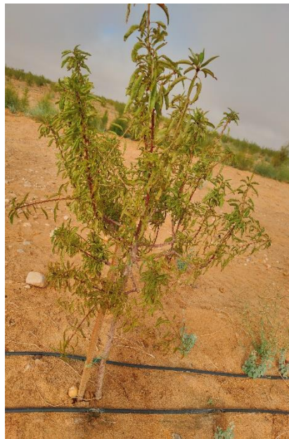
Figure 3 pante LAURANNE AVIJOR