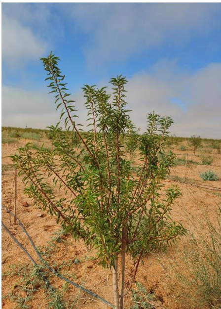
Figure 4: plant MAZZETTO

La thématique apportée dans ce stage est sur l'étude de comportement phénologique de deux variétés différentes d'amandier cultivées dans les mêmes conditions climatiques, par le suivi de différents stades de croissance (Débourrement, floraison, nouaison. Etc.).