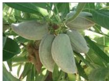
Figure 6:variétés Lauranne avijor