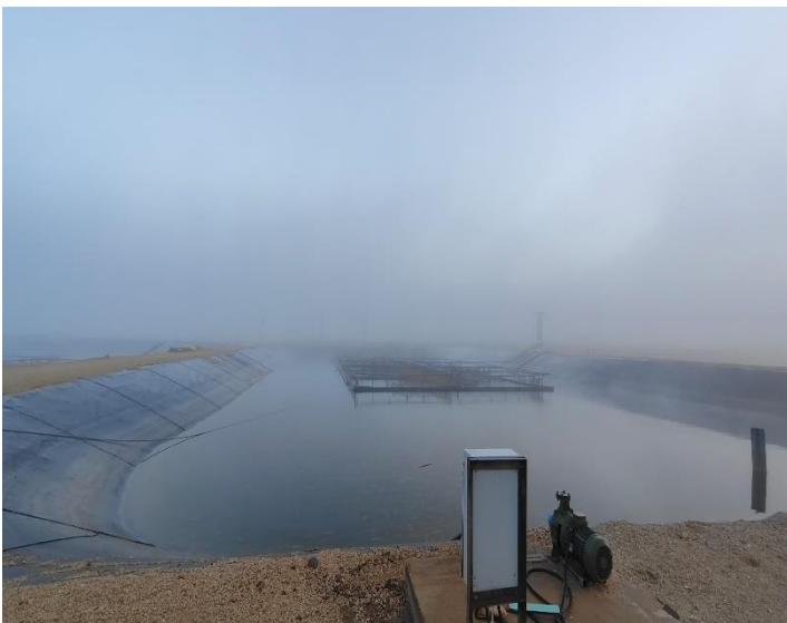
Figure 1: Besan Geo Membrane