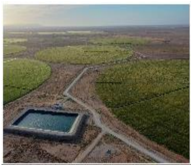
Figure 2: Vue générale de l'exploitation agricole du COSIDER