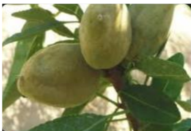
Figure 5:variétés mazzetto