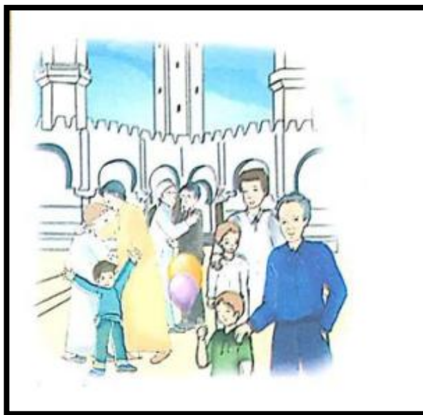
الصورة رقم: (08)