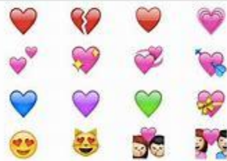
Sentiments et émotions :